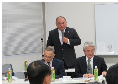
閉会の言葉 青山副会長