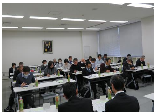
参加された平成30年度理事のみなさま