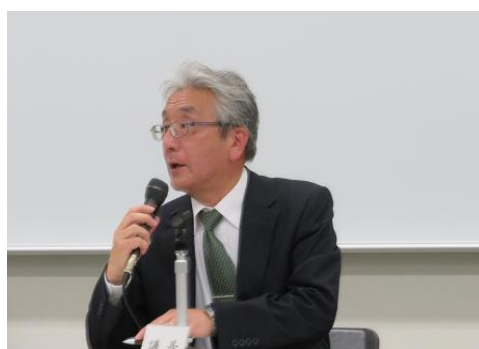
議事進行 慣例により小山会長が議長を務める