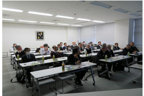
演題「青少年健全育成に向けた県教育委員会の取組」をスライドで紹介いただいた。